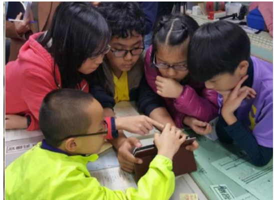
分組進行雲端表單問答