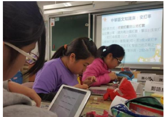
個別進行雲端表單問答