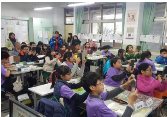
一人一台平板掃描 QR Code