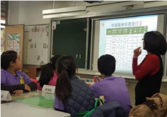
介紹臺灣的安打王和安打率