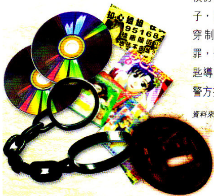
6 色情禍害知多少——真實案例的啟示