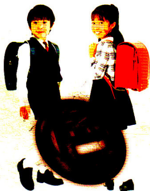
8 色情禍害知多少——真實案例的啟示