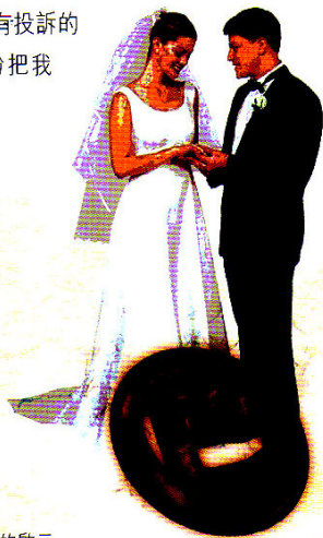
10 色情禍害知多少——真實案例的啟示

資料來源：Russell, Diana E., ed. 1993. Making Violence Sexy . (Buckingham: Open University Press), ch.6.