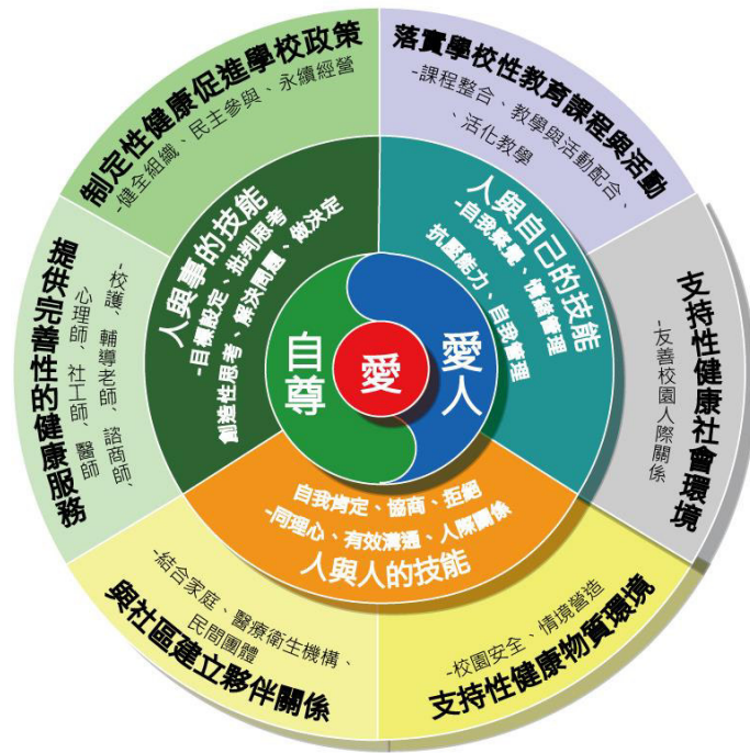
圖4. 學校本位「全人發展」性健康促進學校模式