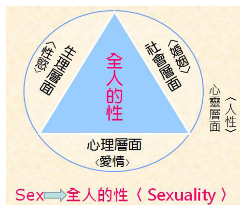
圖 2. 對「性」的概念演變

隨著人類對性的觀點朝向「自由開放」，不再是一項「只能做不能說」的禁忌，各領域對性投入更多的研究，人類性學 (sexology) 成為 20 世紀的一門新興的學問。性是什麼？人類性學的先驅英國性心理學家 靄理士 說 (H. Ellis, 1859-1939)：就是最高的性研究權威也不敢輕易下一個定義。1970 年性學對人類的性已有較整體性的瞭解，提出人類的性應包含性的生理、心理、社會及靈性等四個層面 (見圖 2)；然而有鑑於一般人對性的瞭解，仍停留在生理層面的性。因此，創造 sexuality 這個字來取代原來 sex，sexuality 是指與性有關的層面，為了與原來較偏重生理層面的「性」sex, 所以我們將 sexuality 翻譯為「全人的性」。美國性教育學者 Clark(2004)指出：性教育一直忽略「全人的性」(Sexuality)與「靈性」(Spirituality)是合而為一的整體關係，同時「靈性」也是一個「全人」的兩個重要面向。性教育課程如果沒能將「靈性」層面加入，則就如同一個圓缺一角一樣，不是完整的性教育。Clark 對性教育的未來發展指出：性教育應重視人的「靈性」層面，因為「靈性發展」可協助人類超越個人的生物性，有更寬廣的視野，激發人類發展思考判斷力及創造力，並體會愛的付出及接受是一種奇妙的美善，積極尋求生命的意義與方向。