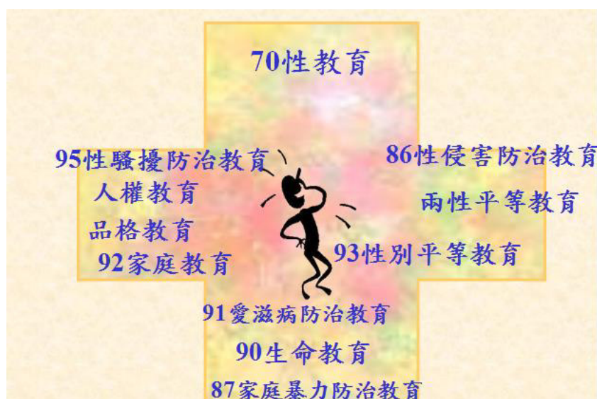
圖 1. 近十年來與「性教育」相關的教育新興議題

增進家人關係與家庭功能之各種教育活動，其範圍如下：親職教育、子職教育、性別教育、婚姻教育、失親教育、倫理教育、多元文化教育、家庭資源與管理教育、其他家庭教育事項。93年因為高樹國中葉永鋳事件，為教導尊重多元性別差異，消除性別歧視，促進性別地位之實質平等，而制定「性別平等教育法」（將兩性平等教育改為性別平等教育），根據該法第17條：國民中小學除應將性別平等教育融入課程外，每學期應實施性別平等教育相關課程或活動至少四小時。又根據該法實行細則第十七條第二項所定性別平等教育相關課程，應涵蓋情感教育、性教育、同志教育等課程，以提昇學生之性別平等意識。又根據「性別平等教育法實行細則」第2條所謂尊重多元性別差異，消除性別歧視，勿進性別地位之實質平等，指任何人不因其生理性別、性傾向、性別特質或性別認同等不同，而受到差別之待遇。